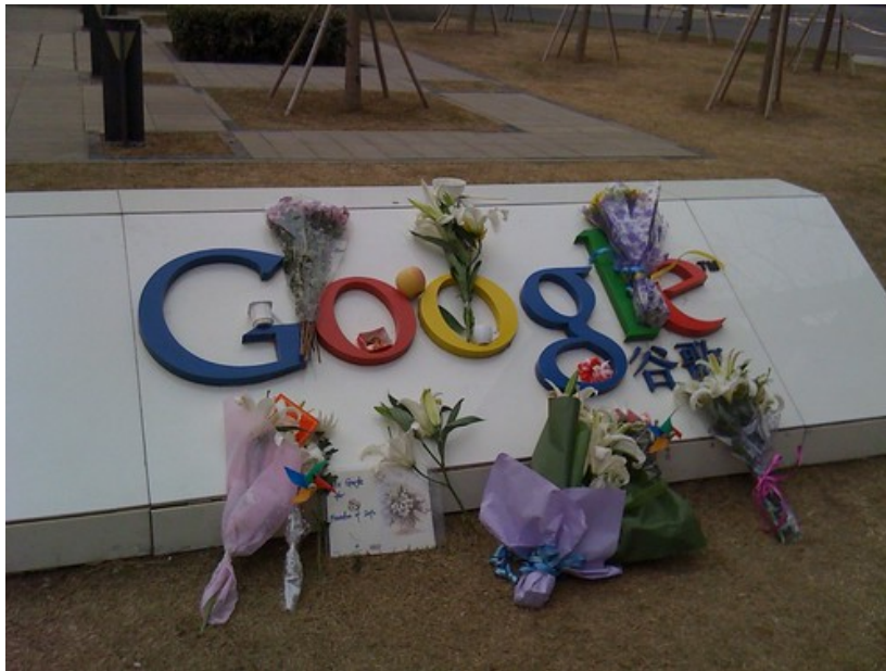
晚上8点左右，网友陆续到Google总部门前非法献花，还有人带来了蜡烛，估计高峰时期有50人在场。